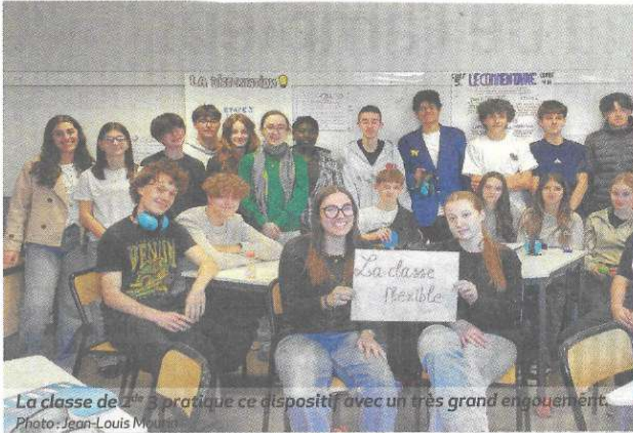
La classe de 2 de 3 pratique ce dispositif avec un très grand engouement.

LYCÉE BOISSY D'ANGLAS Au lycée, le dispositif innovant de la classe flexible est pratiqué. Cette pédagogie met en exergue l'autonomie de l'élève, repense l'espace classe mais aussi la relation apprenants-enseignant.